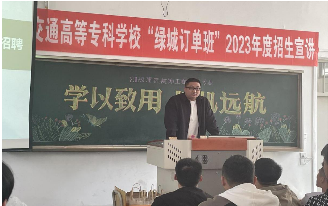
图 4 2022 年 3 月 31 日订单班开班仪式

此次订单班招生宣讲，标志着我校与绿城建筑科技集团校企合作的进一步深化，双方将共同研究人才培养方案、开发课程标准、共同打造师资团队、共同建立企业人才培训基地，为装饰行业提质培优和快速发展提供人才保障。